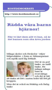
Rädda våra barns hjärnor!

I Livsmedelsverkets personalhandbok ”Mat för spädbarn och småbarn” står det: ”Föräldrarna bestämmer vad som ska serveras och barnet om, och hur mycket, det vill äta av den mat som serveras”.