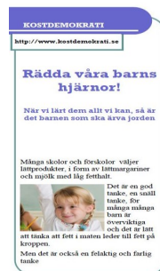
Rädda våra barns hjärnor!

I Livsmedelsverkets personalhandbok ”Mat för spädbarn och småbarn” står det: ”Föräldrarna bestämmer vad som ska serveras och barnet om, och hur mycket, det vill äta av den mat som serveras”.