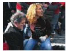
En sjukvårdare tar hand om en skadad demonstrant i Aten i går.

Larmen från skolorna till Arbetsmiljöverket har nästan fördubblats på fem år. Klagomålen gäller den fysiska miljön, för hög arbetsbelastning och felbemanning. Nyheter sid 8-9