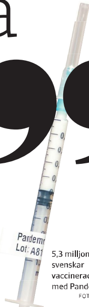
5,3 miljoner svenskar vaccinerades med Pandemrix.