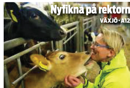
Nyfikna på rektorn VÄXJÖ • A12

TINGSRYD • A18 Ett avtal mellan Tingsryds kommun och Svenska kyrkan gör det möjligt att behålla traditionen med skolavslutning i kyrkan.